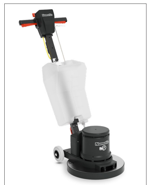
Optioneel vloeistoftank Art. 606890

Dit model is voorzien van de zeer krachtige Hurricane 1500 Watt motor die grotere belasting door snelheid of extra gewicht makkelijk aan kan. Het duurzame oliege vulde planetaire tandwielhuis brengt met gemak de kracht van de motor over op de vloer waardoor een perfect resultaat gegarandeerd is. Deze machine met een toerental van 150 TPM is inzetbaar voor de meest voorkomende werkzaamheden met een eenschijfsmachine. De HFM1515R ReFlo incl. WWA 33-gewicht-stofopvangring-y-adapter wordt geleverd zonder borstel of padhouder en is door een uitgebreide range van accessoires, bij werken met vloeistof, sprays of afzuiging inzetbaar.