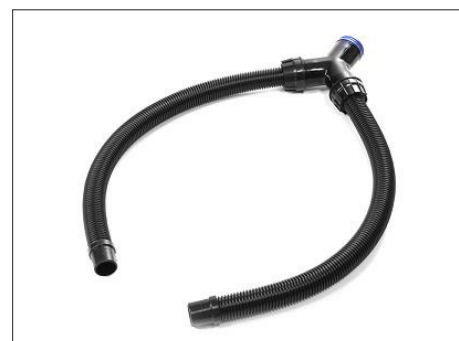
Y-adapter Art. C887112