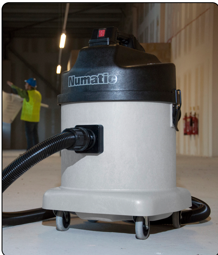
NED 570A Art. 905527