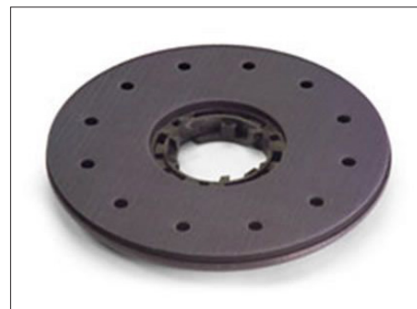
WWA 33 padhouder 400 mm Art. 606620