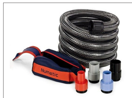
Kit ND5 Art. C864150